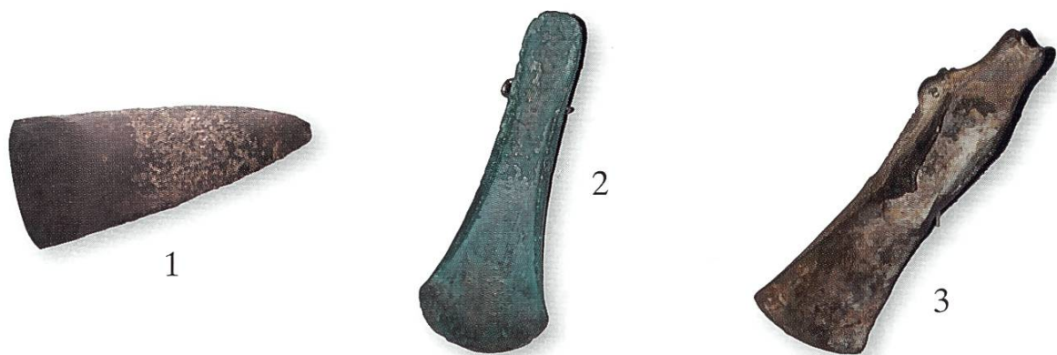
Abbildung 1 – Drei prähistorische Beile der March. Die drei Beile belegen nicht nur technische Entwicklungen vom Steinbeil zum Beil aus Bronze, sondern auch Einwirkungen der Umgebung, sehen doch die beiden Bronzebeile wegen der unterschiedlichen Lage in der Erde und im Wasser verschieden aus.