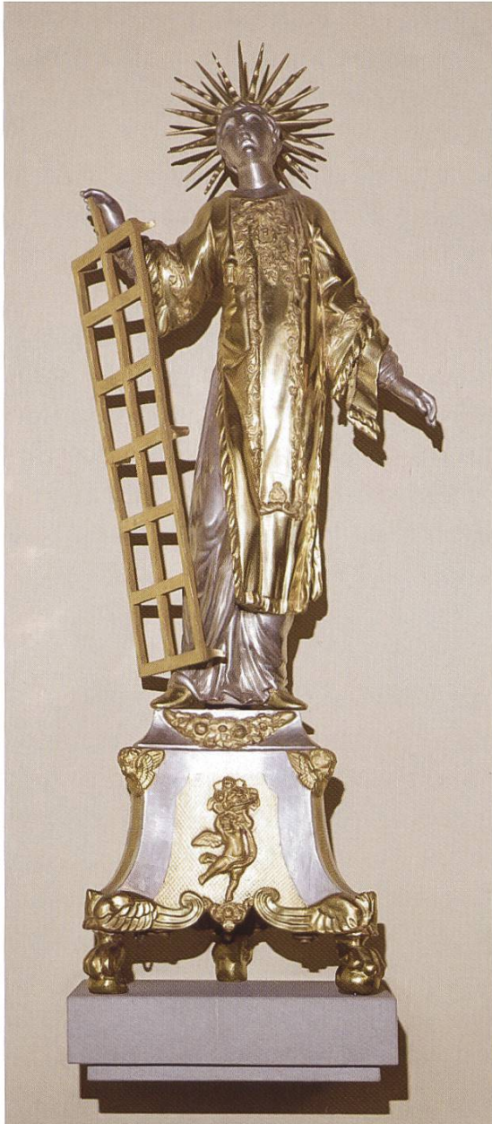
Abb. 1: Der Reichenburger Kirchenpatron St. Laurentius.

Barocke Statue (Holz, gold- und silbergefasst, um 1750), in die heutige Pfarrkirche übernommen.