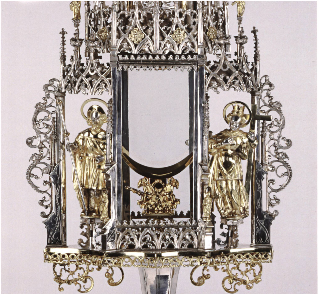
Abb. 3, zu Seite 11