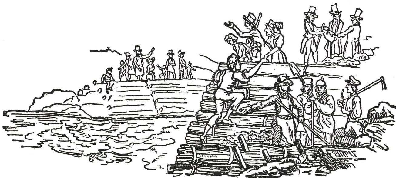
Hans Conrad Escher leitet 1811 die Linth in den Walensee. Der Durchbruch ermöglichte es in der Folge, die chronisch überschwemmte Gegend zu sanieren, die Flussstrecke trägt heute den Namen ihres Retters (Escherkanal).

des sanierten Landes einheimste. 21 Mitte März 1807 gab der Landammann des aktuellen Kantonsvorsitzes Zürich den Beginn der Unternehmung bekannt. Hans Conrad Escher präsierte die fünfköpfige Aufsichtskommission und organisierte mit beigezogenen Ingenieuren das Linthwerk. Eine fürs Geld verantwortliche Schat-