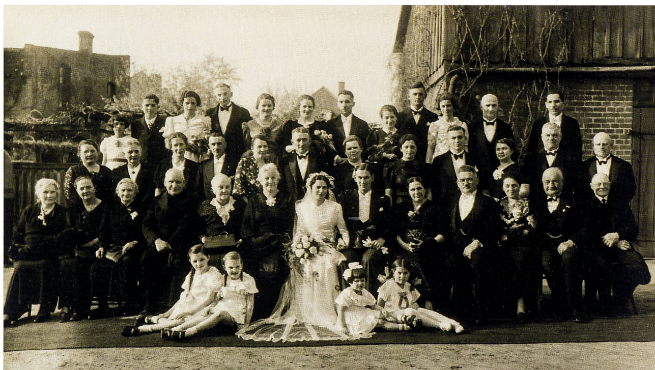
Hochzeitgesellschaft 1938