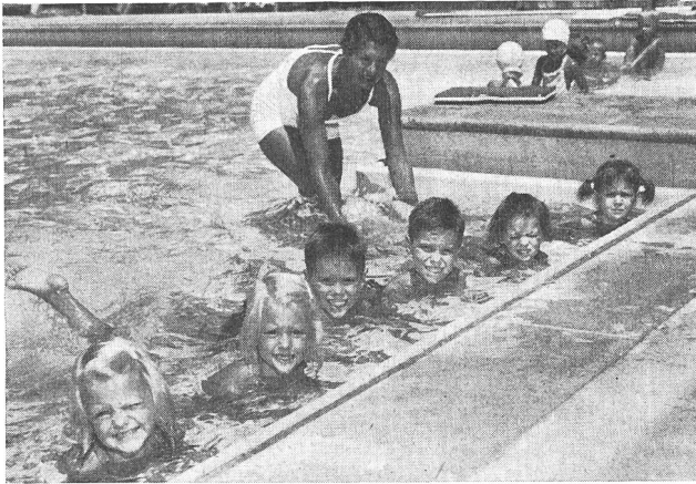
5jährige erlernen den Crawl-Beinschlag.

mann, der schwimmtechnisch gut genug ist, kann schon ab 12 Jahren das Junioren-Brevet und von 16 an das Senioren-Brevet erwerben.