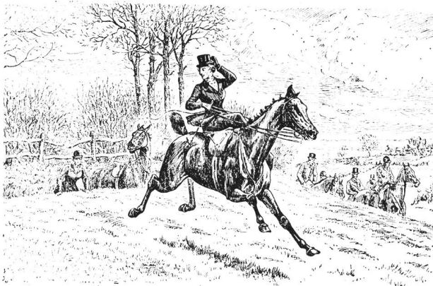
Flotte Hindernisspringerin 1897, im Damensitz (aus der englischen Zeitschrift Punch)

zugewandt. Wir denken da nur an das Schlittschuhfahren und den Wintersport im ganzen gesehen. Dem Eislauf standen sie anfänglich eher zurückhaltend gegenüber. Einzig in der Urheimat des Eislaufs, wie man Holland nennen möchte, haben Frauen schon seit dem 14. Jahrhundert sich am Schlittschuhlauf ergötzt und sogar Wettläufe durchgeführt. In den deutschsprachigen Ländern aber wagten sie sich bis vor etwa hundert Jahren kaum aufs Eis, es sei denn, sie hätten sich in einem Stuhlschlitten, einem sogenannten Storch, über die spiegelglatten Flächen schieben lassen. Klopstock und Goethe haben mit ihren Gedichten und auch durch ihre Einladungen an Damen der Gesellschaft, sich diesem Sport hinzugeben, wesentlichen Anteil an der