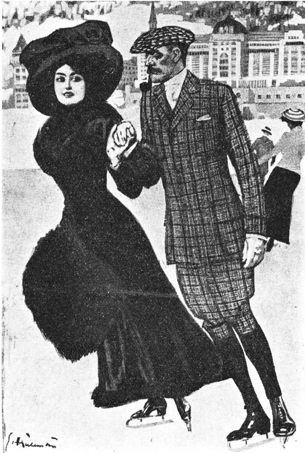
Eisläuferpaar in St. Moritz um 1905. Zeichnung von Ernste Heilemann

Um aber die vielen alten Vorurteile und die tief eingewurzelte Prüderie mancher Volksschichten zu überwinden, brauchte es erst noch einen jahrzehntelangen Kampf, und es ist noch nicht so lange her, dass mir ein alter Turnpädagoge erzählte, welche Hemmungen die Frauen gehabt hätten, in Turnröckchen im geschlossenen Turnraum zu erscheinen. Erst fünfundsiebzig Jahre nach dem Erscheinen der Kalisthenie bildete sich in Zürich die erste Damenturngesellschaft (1893). Einen grossen Aufschwung bekam die Frauen-