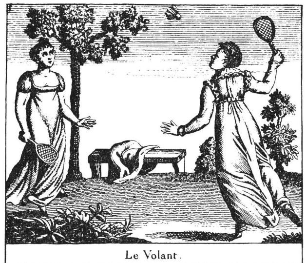
Federball zur Zeit des Empire um 1803

1854), der 1829 sein Buch «Kalisthenie» in Bern herausgab, welches das erste Lehrbuch für das Mädchenturnen überhaupt darstellt. Die Schweiz darf also für sich den Ruhm beanspruchen, die Wiege des Frauenturnens zu sein. Clias hatte schon drüben in England als königlicher Turninspektor an Militärschulen seine ersten Versuche mit dem Mädchen- und Frauenturnen gemacht, um dann, in die Schweiz zurückgekehrt, in Itigen bei Bern sein wegweisendes Buch zu schreiben, das bedeutender ist als sein mehr als ein Jahrzehnt früher erschienenes Werk, das zu sehr sich an ältere Vorbilder klammerte, ja die Schriften früherer Pädagogen und Anreger der Gymnastik bedenkenlos plagierte. Freilich mögen da und dort schon vor Clias Frauen gymnastische Übungen ausgeführt haben, doch Clias übertrug nicht wie seine Vorgänger einfach die Übungen für Jünglinge und Männer auf die Mädchen und Frauen, sondern ersann Übungen, die der weiblichen Konstitution angepasst waren. Wenige Jahrzehnte später hat dann der aus Hessen stammende, in Burgdorf und Basel so segensreich wirkende Pädagoge Adolf Spiess (1810—1858) Mädchen innerhalb und ausserhalb der Schule zum Turnen angehalten. Weitgehend von Clias inspiriert gaben 1835 K. L. Helder mann in Deutschland und der Zürcher Professor Hans Heinrich Vögeli (1810