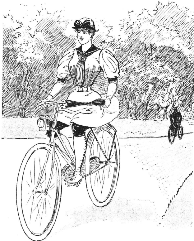
Pariser Velofahrerin um 1892