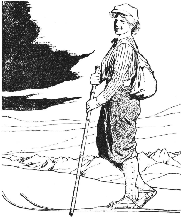
Einstockfahlerin in elegantem Dress im Jahre 1912