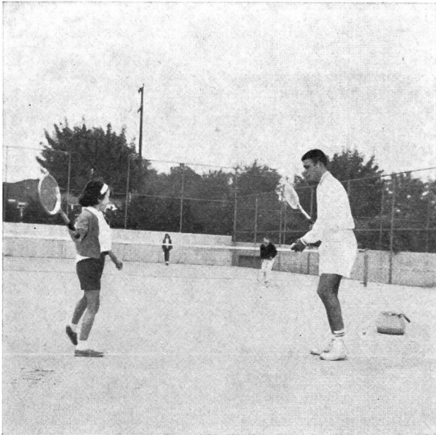
Der Lehrer zeigt die korrekte Beinarbeit mit Gewichtsverlagerung.

Ein vom Klub angestellter Tennislehrer erteilt der Fortgeschrittenengruppe gegen eine Gebühr einen jeweils zwanzig Minuten dauernden Unterricht zur För-