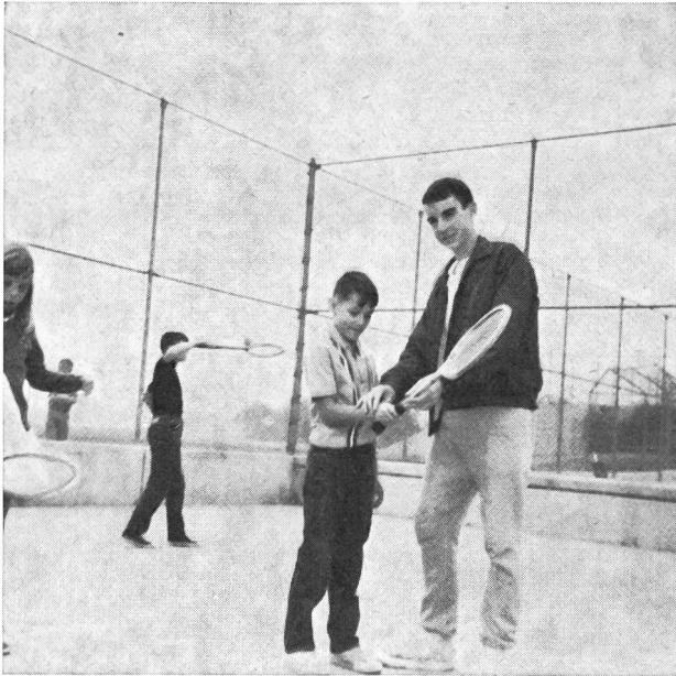
Wie muss der Schläger in die Hand genommen werden?

Es ist bewundernswert, mit welchem Elan und Interesse der Jugendsport in Nordamerika gefördert wird, sei es in den High Schools, Colleges, in städtischen Parkanlagen oder durch private Klubs. Ein sehr be-