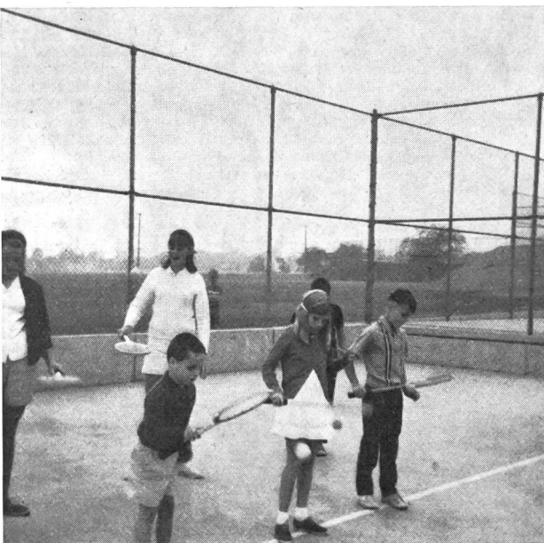
Als zweites folgen für den Anfänger Ballangewöhnungsübungen.

In erster Linie sind es die High Schools (Oberschulen), die dem Jugendtennis Aufschwung gaben, da an all diesen Schulen sechs bis zwölf Spielfelder vorhanden sind. Als freiwilliges Fach erfreut sich Tennis grosser Beliebtheit, und Schülertennismeisterschaften gehören