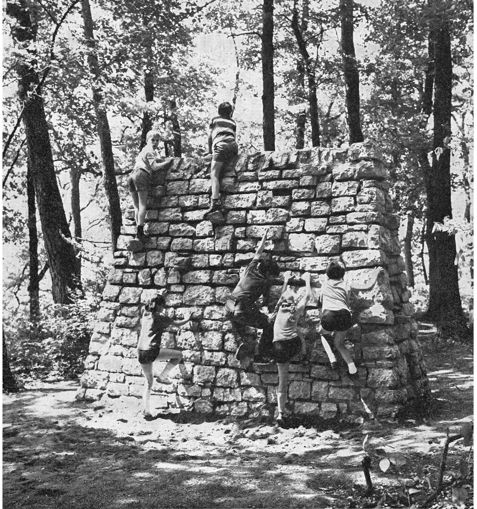
« Le Chanet »