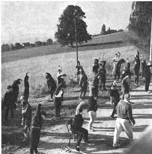
Frühturnen mit Eugen Weinmann