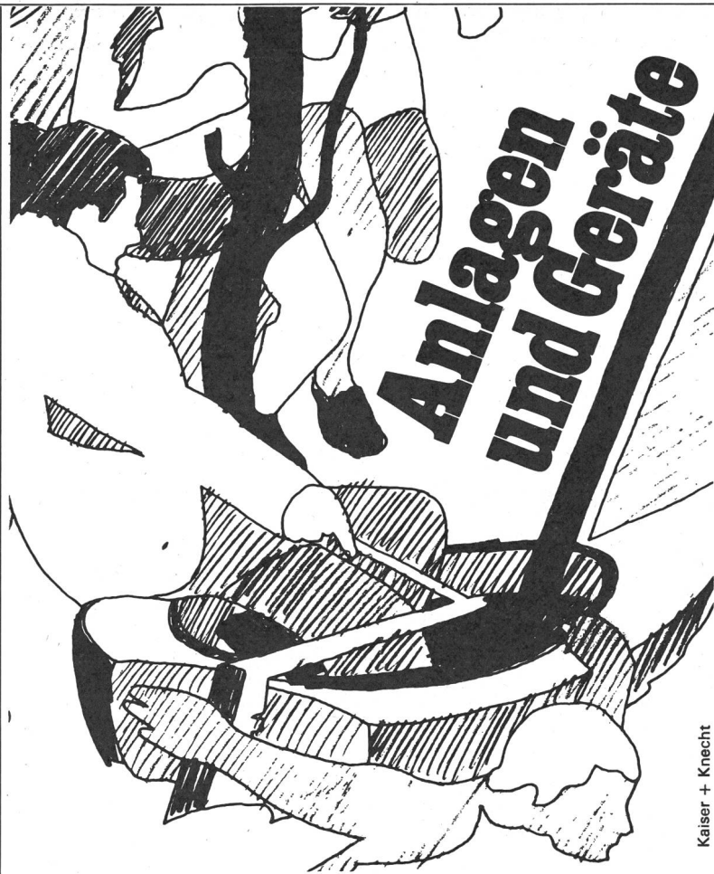
Kaiser + Knecht