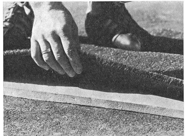
Das Bild zeigt den Unterbau, einen Asphaltstrassenbelag, den Pad, einen etwa 16 mm dicken Schaumgummi und die rasenähnliche Oberfläche aus robusten Nylonfasern (etwa 13 mm).

Weitere Informationsmöglichkeiten geben die Tagungsprotokolle der Vereinigung Schweizer Stadtgärtnereien und Gartenbauämter VSSG, Monbijoustrasse 36, 3000 Bern, Tel. 031/64 69 11. Die Eidg. Turn- und Sportschule verfügt über keine spezialisierten Naturrasen-Fachleute.