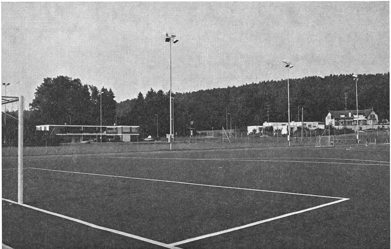
Gesamtansicht des ersten in der Schweiz durch Monsanto erstellten Astro-Turf-Kunststoffrasen-Sportplatzes Fallacher in Küsnacht ZH.

Wenn an heissen Sommertagen das «Kleinklima» auf Kunststoffplätzen durch die mit dem Unterbau verbundene Wärmestauung unerträglich wird, kann dies durch Bewässern des Rasens kompensiert werden. Demgegenüber steht eine bei jedem Wetter unbeschränkte Benutzbarkeit des Kunstrasens, die — wenigstens für die getesteten Produkte — auch bei Feuchtigkeit grösste Trittsicherheit garantiert. Unschlagbar ist die ständig volle Belastbarkeit des trockenen wie des nassen Kunstrasens über den grössten Teil des Jahres. Die für Naturrasen so notwendige Winterpause, die bis in die frühjährliche Wachstumsperiode verlängert werden sollte, entfällt mit Ausnahme der ausgesprochenen Frostperiode, wo auch der Kunstrasen vereist sein kann. Die Schneeräumung auf Kunstrasen ist mit entsprechenden Geräten möglich, wo nicht eine Rasenheizung vorgesehen ist, um Schnee und Eis abzutauen. So hält der Kunstrasen einer Beanspruchung stand, die für einen aufgeweichten Naturrasen eine massive Beschädigung mit langer Regenerationszeit bedeuten würde. Zudem ist er sowohl bei Regen als auch unmittelbar nach Regen sofort wieder bespielbar.