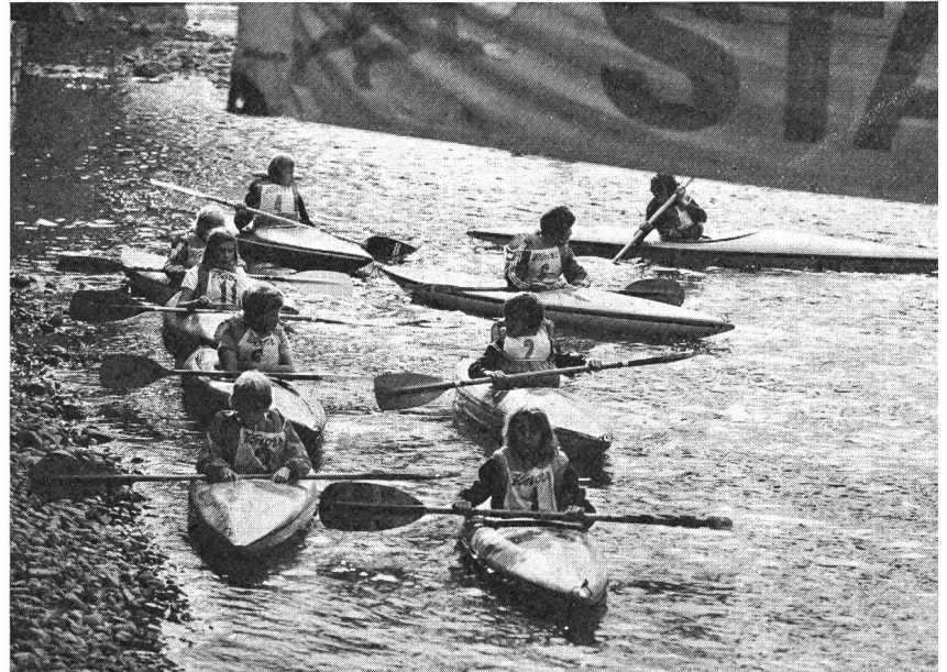
Konzentration vor dem Start

Bild und Text: Hugo Lörtscher ETS Magglingen