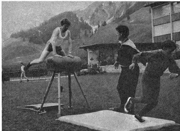
Schulendprüfung in Sedrun.

Von den etwa 1000 verschickten Fragebogen konnten deren 750 ausgewertet werden. Die Auswertung hat ergeben, dass rund 66 Prozent der Knaben drei Turnstunden pro Woche erteilt erhalten und nur etwa 50 Prozent der Mädchen den vorgeschriebenen Turnunterricht