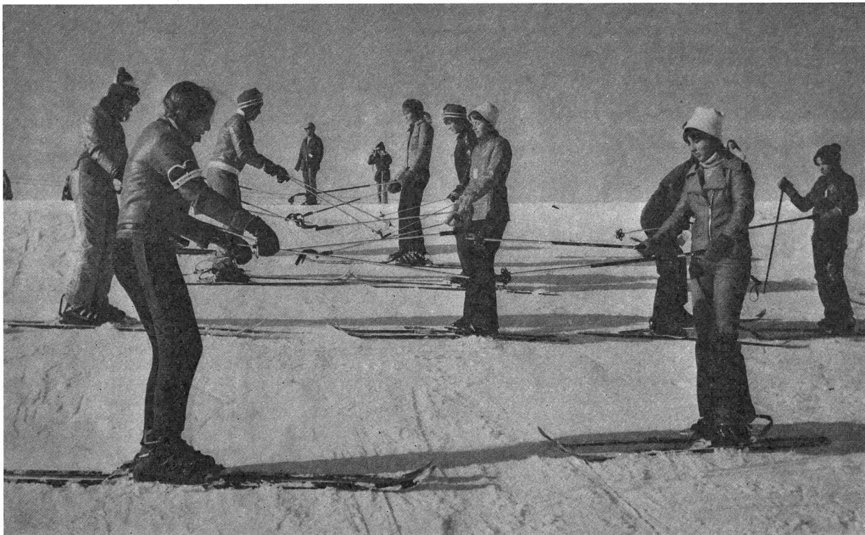
Im Kantonalen J + S-Lager Splügen.

Für diese Gruppe wird das wirksamste Mittel die Information über das J+S-Angebot sein und dann, wenn sie sich zum Mitmachen entschlossen haben, ihnen ein positives Sporterlebnis zu vermitteln.