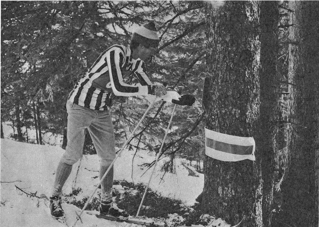
1. Bündner Ski-OL — «Auf Postensuche».

Selbstverständlich gelten diese Zeitangaben für die schneefreie Zeit.