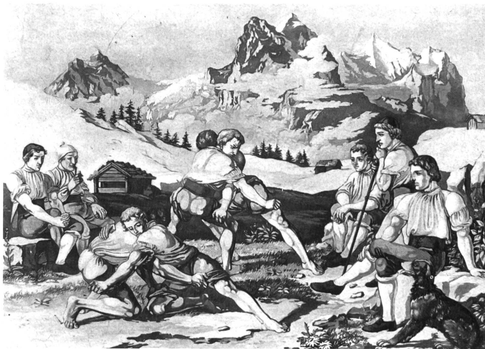
Schwingen auf der Kleinen Scheidegg um 1830.

soweit zurück, als davon Nachrichten vorhanden sind. Da ist vor allem das älteste Bilddokument aus der Mitte des 13. Jahrhunderts zu nennen, eine Holzschnitzerei am Chorgestühl in der Kathedrale zu Lausanne, das eindeutig zwei Schwinger darstellt. Ungefähr aus der gleichen Zeit stammt die Zeichnung des Architekten Villard de Honnecourt, welche vielleicht das nämliche Schwingerpaar darstellt. Seit dem 10. Jahrhundert ist auch für die Insel Island ein Zweikampf beglaubigt, bei dem man sich wie beim Schwingen an Hosengurten festhält, also ein Kleiderringen, wie es auch noch im salzburgischen Alpenland als Kleiderangeln bezeichnet ist, ebenfalls für Skandinavien, wo es «Byxkast», bisweilen auch Bälgekast genannt und auf den Kanarischen Inseln. Am meisten Verwandtschaft mit unserem Schwingen besitzt das isländische «Glima». Es ist bereits in der Sagazeit um 900 auf Thingstätten von der männlichen Jugend Islands mit Eifer betrieben worden. Wie bei uns Schwingerkönige ernannt werden, so hat man auf Island Glimakönige auserkoren. Die Glimakämpfer tragen um Leib und Oberschenkel Riemen, die an der Hüfte durch senkrechte Stege miteinander verbunden sind. Schon bei