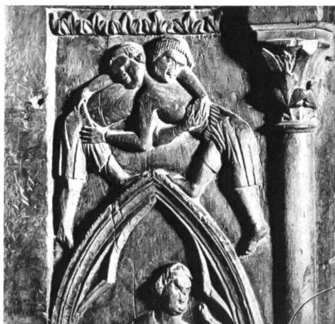
Die älteste bildliche Darstellung des Sportes in der Schweiz stellt eine Schnitzerei am Chorgestühl der Katedrale von Lausanne aus dem Jahre 1235 dar. Es handelt sich um die Wiedergabe des ältesten Sportes der Schweiz, des Schwingens. Das Schweizerische Turn- und Sportmuseum in Basel besitzt allerdings nur eine Grossphoto des Originals.

Interessant ist nun aber, dass bei diesem scheinbar typisch eidgenössischen «Spiel» Nachrichten aus früheren Zeiten aus der Schweiz nicht überliefert, hingegen im Ausland häufig vorhanden sind. Schon Gerhard Ulrich Anton Vieth konnte 1818 bereits auf ältere Quellen hinweisen, so z. B. auf ein eigentliches Lehrbuch für Fahnenschwinger, das 1673 in Halle/S. erschienene Werklein «Deutliche Beschreibung unterschiedlicher Fahnlektionen...» von Johann Georg Pascha, das neben der deutschen sogar eine französische Ausgabe erlebte. Vieth widmet dem Fahnenschwenken, wie er es nennt nicht weniger als 20 Druckseiten. Er führt da unter anderem an, dass es schon zu Valentin Trichters Zeiten (um 1742) zur Antiquität und nur noch selten ausgeübt worden sei. In seinem Exerzierreglement bedauerte Trichter nämlich, dass an Aufzügen und Paraden das so schöne Fahnenschwingen fast verschwunden sei, einzig noch herumziehende