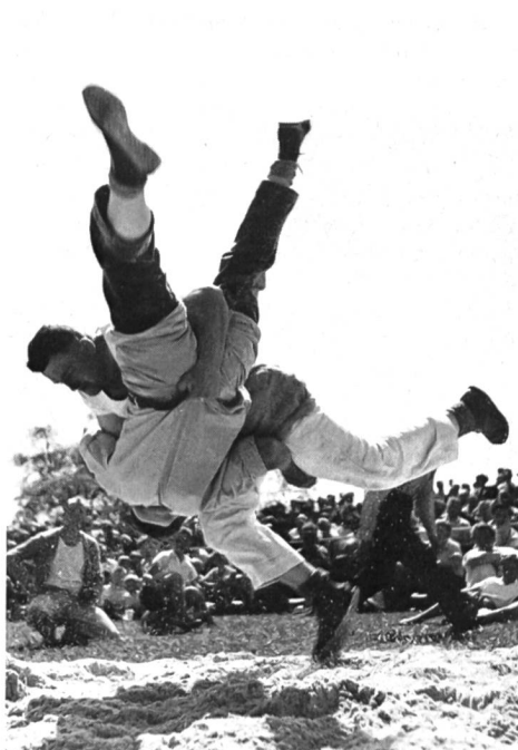
Zu jedem Alplerfest in der Schweiz gehört das traditionelle Schwingen.