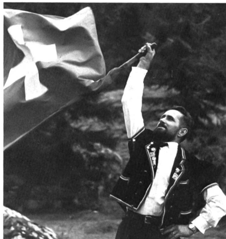
Zu jedem Älplerfest in der Schweiz gehören Fahnen Schwinger.

Der um die Förderung der Leibesübungen so verdiente Franz Josef Stalder schreibt 1791, dass Schüler sehr gerne das Plattenspiel betrieben hätten, wie auch in den Philanthropinen um 1770 das Plattenwerfen in der Freizeit üblich war. Mit dem Sturz des Ancien régime hören die Verbote aber auch die Nachrichten über das Plattenschiessen in der Schweiz fast ganz auf. Einzig aus dem Ringgenberg (Kanton Bern) wird berichtet, dass man 1860 mit 1 bis 2 Kilogramm schweren flachen Steinen nach dem zehn bis fünfzehn Meter entfernten Ziele warf und im Nidwaldner Kalender von 1888 steht zu lesen,