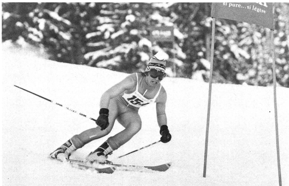
Eine der 3 Triathlon-Disziplinen, der Riesenslalom

Wer noch zu jung ist, um einen der alljährlich in der ganzen Schweiz durchgeführten Jungschützenkurse zu besuchen, besorgt sich ein Luftgewehr und schießt im Keller auf eine selbstgebastelte Scheibe mit Kugelfang (Vorsichtsmassnahmen beachten!). Für Junioren empfiehlt es sich, einen Jungschützenkurs zu besuchen und das Training im Schützenverein unter kundiger Leitung fortzusetzen. Ältere Teilnehmer, die die RS besucht haben, benützen für das persönliche Training die Ordonnanzwaffe. Jeder hat seine persönlichen Schwächen (er-