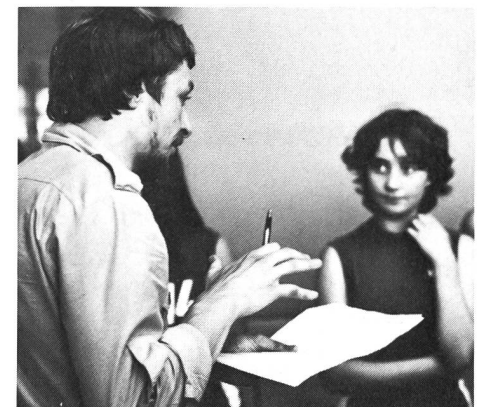
Coaching im Basketball während einer Auszeit.

Unestahl, L.-E. und Martell, J.-H. , Das Mentale Training , The department of sportpsychology, Orebro-University, Orebro (S), als Sonderdruck für die Frühjahrestagung der Verbandstrainer, Magglingen 1982.