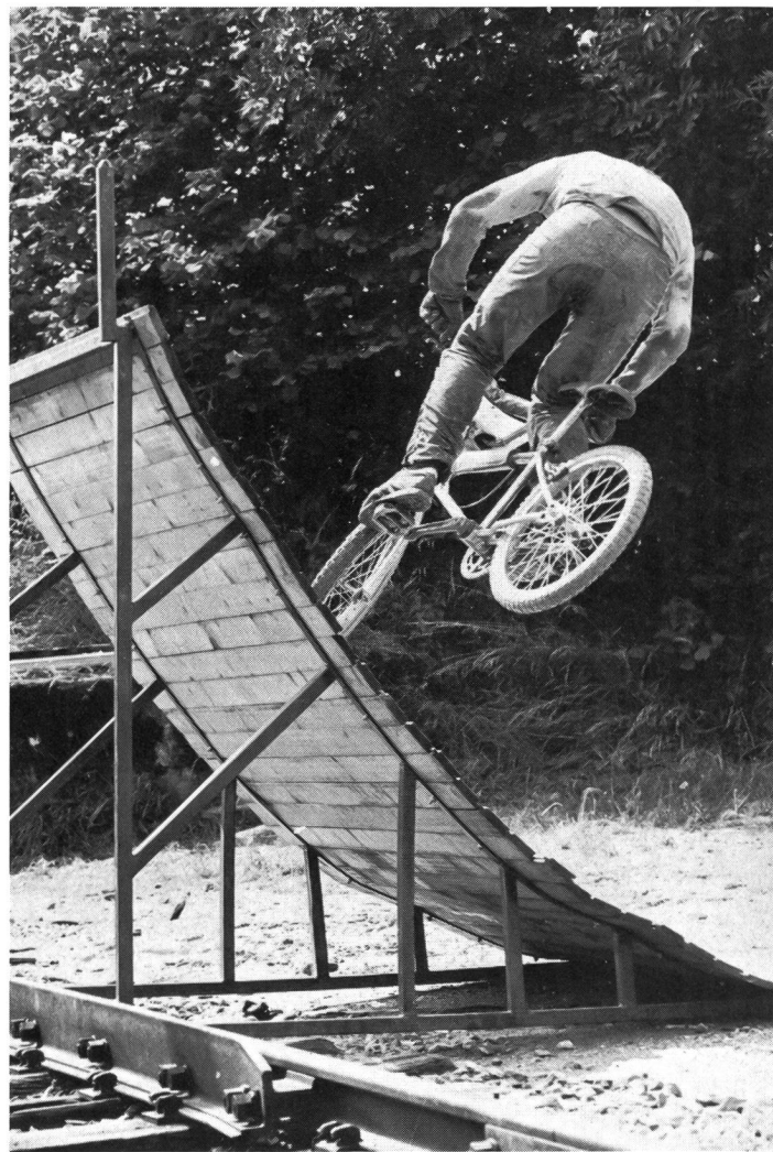
Befahren einer Holzrampe und Wende in der Luft um 180 Grad.