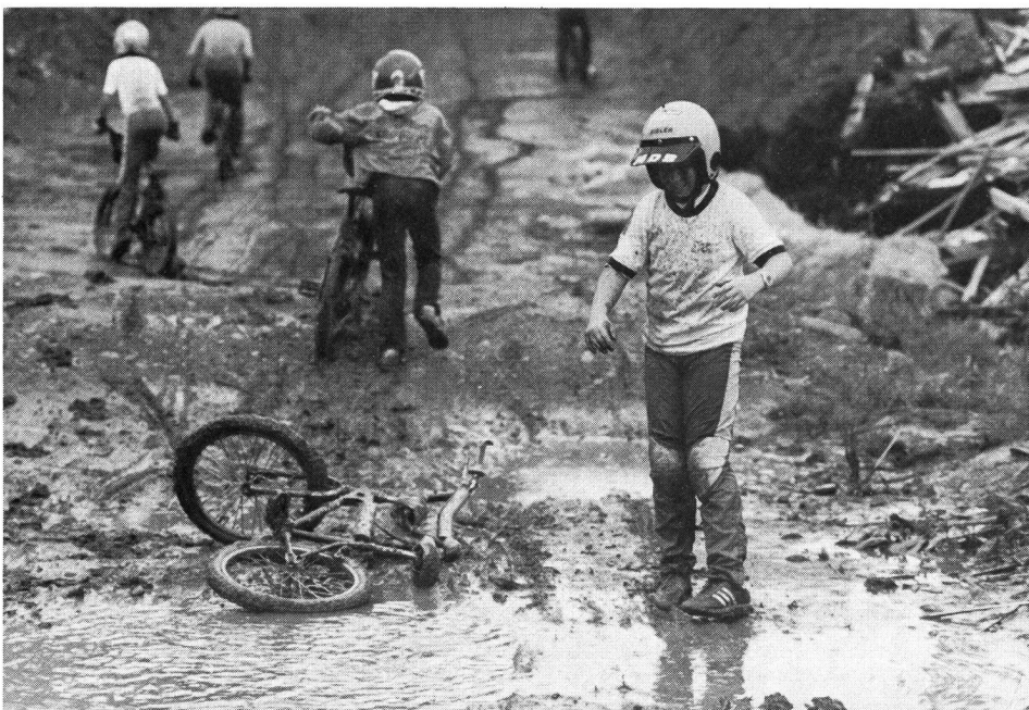
«Eine schöne Mohrerei!»

Auf einer mit natürlichen Hindernissen versehenen Geländerennbahn von 270 bis 350 Metern Länge werden Sprintprüfungen mit Spezial-Velos durchgeführt. Ende der sechziger, Anfang der siebziger Jahre entwickelte sich diese Sportart in Amerika. Vor einigen Jahren fasste sie auch in Europa Fuss und hat sich vor allem in Holland, England, Belgien und Frankreich sehr schnell ausgebreitet. Während es in Amerika über 100 000 lizenzierte Fahrer gibt, wurde in der Schweiz dieses Jahr zum ersten Mal eine Meisterschaft mit 70 Aktiven durchgeführt.