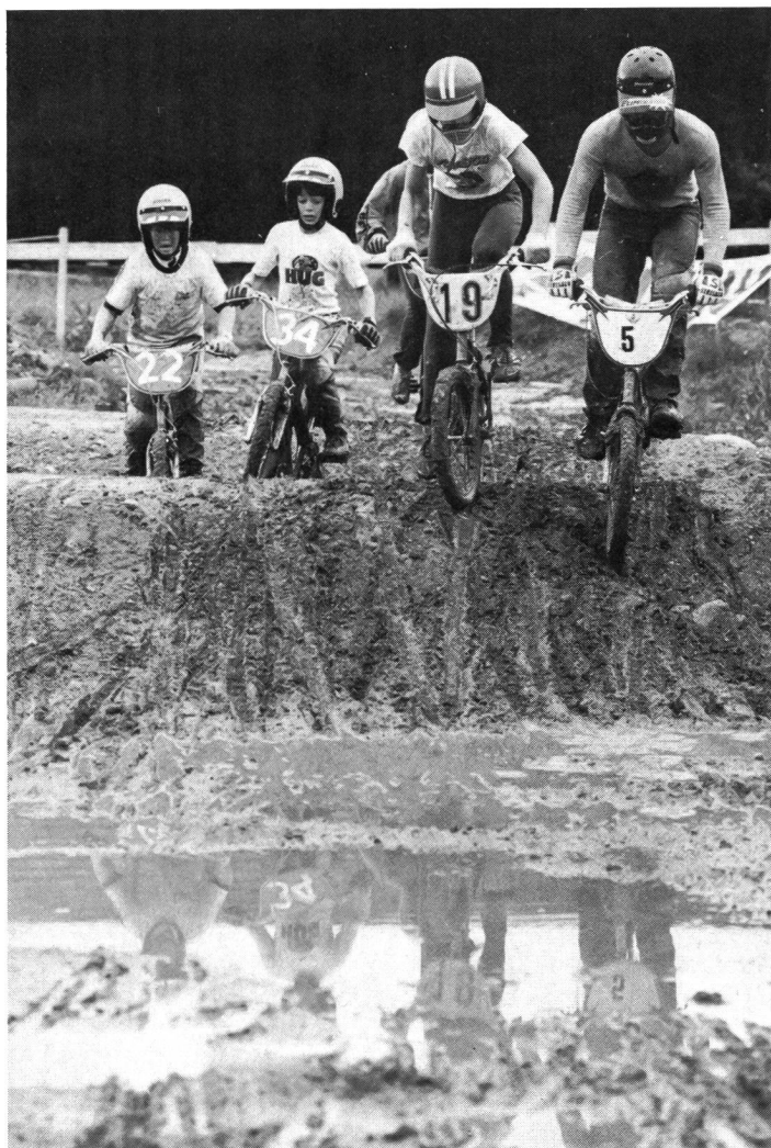
Nichts für Zärtlinge...

Fahrer, vom Anfänger bis zum Profi hat, ist die Wahl der Übersetzung. Eine zu leichte Übersetzung bringt zwar einen schnellen Start, aber eine langsame Endgeschwindigkeit. Bei zu schweren Übersetzungen kommt der Fahrer am Start nicht richtig weg und verliert entscheidende Sekunden. Einige Tests mit verschiedenen Übersetzungen lohnen sich deshalb vor dem Kauf eines Cross-Velos. Dieses kostet immerhin zwischen 400 und 600 Franken, eine Luxusausführung gar 1000 Franken. ■