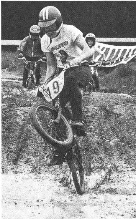
Wer schafft es auf einem Rad?