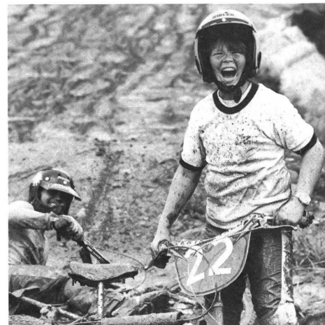
Des Jungen Freud – der Mutter Leid!