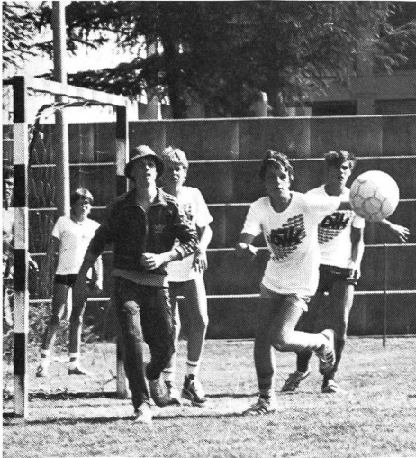
Internationales Jugendlager SKTSV 1984 in Beromünster.