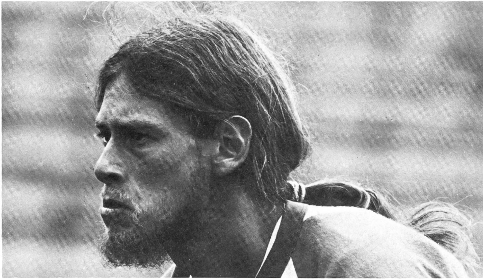
Bei aller Verspieltheit und Bewegungslust widerspiegelt sich in den Gesichtern der Frisbee-Spieler volle Konzentration – oder auch wilde Entschlossenheit.

Die Zahl der aktiven Frisbee-Spieler wird weltweit auf eine Million geschätzt. Den grössten Harst und auch die meisten Sieger stellt das Ursprungsland USA, inzwischen jedoch ist dem Lehrmeister mit Japan und Schweden harte Konkurrenz erwachsen. In der «International Frisbee disc Association» sind 100 000 Mitglieder vereinigt, doch dürfte sich deren Zahl bald einmal verdoppelt haben, breitet sich Frisbee doch wie ein Flächenbrand über alle Kontinente aus. In der Schweiz beginnt der Flugscheibensport, wie Frisbee auch benannt wird, erst richtig Fuss zu fassen. Die Gründung des Schweizer Frisbee-Verbandes erfolgte erst 1980, doch kommt es laufend zu Klubgründungen. Gleichzeitig mit dem nationalen Verband wurden in Luzern die «Flying Saucers» gegründet, es folgten in Winterthur die «Sky Hawks», in Basel die «Lawn Sweepers» und in Bern die «Flying Angels».