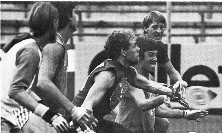
Die Mannschafts-Disziplin «Guts» gleicht einer mittelalterlichen Schlacht. Fünf auf einer Linie aufgepflanzte Spieler müssen versuchen, eine von einem Gegner in 14 m Entfernung mit aller Kraft entgegengeschleuderte Frisbee-Scheibe mit einer Hand zu fangen.

Bei allem berechtigten Optimismus dürfte der Frisbee-Wettkampfsport in der Schweiz noch für eine Weile ein Mauerblümchenda-sein fristen. Vielleicht vermag unsere Reportage dem phantasiereichen Spiel mit der fliegenden Plastikscheibe neue Freunde zu gewinnen? ■