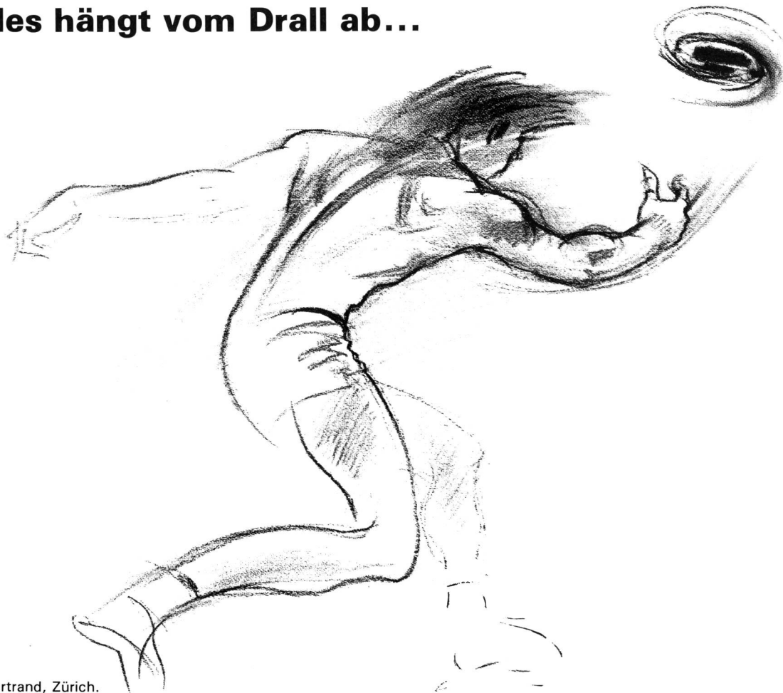
Zeichnung: Jean-Louis Bertrand, Zürich.