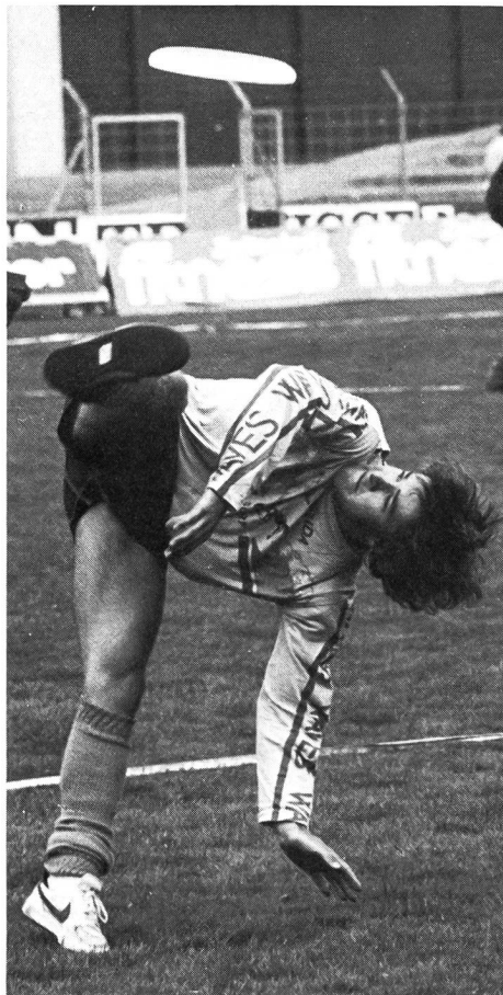
«Freestyle», die Königsdisziplin des Flugscheibensports, verlangt Phantasie, Kreativität und artistische Körperbeherrschung.

Es war einmal in der «guten, alten Zeit» (so um die Jahrhundertwende) eine gute, alte Bäckersfamilie im US-Bundesstaat Connecticut namens Frisbee, welche berühmt war für ihre in Metallformen gebackenen Lebkuchen. Eines Tages kamen spielende Kinder und Studenten auf die Idee, die von den Kunden jeweils weggeworfenen metallenen Unterteller der Lebkuchen als Flugscheiben durch die Luft segeln zu lassen. Dieses sah nach wiederum längerer Zeit (man schrieb bereits das Jahr 1950) ein cleverer Spielzeugfabrik-Manager namens Walter Frederic Morrison mit visionärem Gespür und ging daran, die Kuchenteller von einst durch flugfähige Plastikscheiben zu ersetzen – und erfolgreich zu vermarkten. Freilich hätten die Plastikscheiben, auf den Boden gestellt, ebenso gut als Futternapf für Hunde und Katzen dienen können. Aber mit einem Drall in die Luft geschiefert, schwebte das profane Ding schwerelos dahin wie ein Gedicht und verzauberte für Sekunden die ganze Welt. Damit war «Frisbee», das nach der legendären Bäckersfamilie aus Connecticut benannte Freizeitvergnügen, geboren.