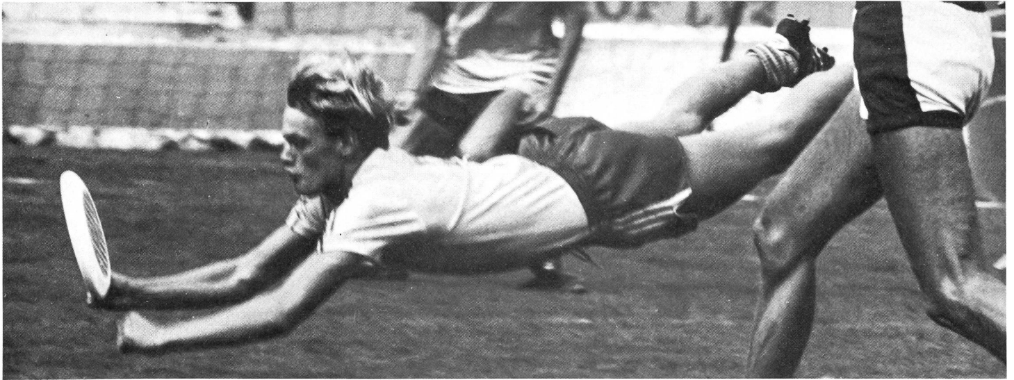
Das Mannschaftsspiel «Ultimate» verlangt ein geradezu artistisches Können.

Eine fliegende Untertasse macht Karriere: