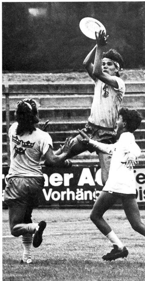
Schweden und USA dominieren klar die internationalen Frisbee-Turniere sowohl in der Disziplin «Ultimate», wie auch in jener der «Guts».