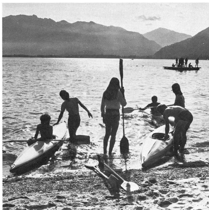
Am sandigen Ufer des Lago Maggiore, scheinbar unberührt von der Zeit.