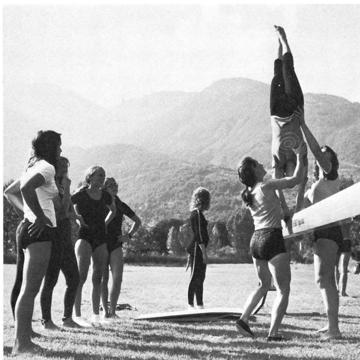
Kunstturnerinnen zur Zeit der siebziger Jahre.

Während der ganzen Entwicklung waren die Anregungen der Lagerleiter und Sportlehrer notwendig und nützlich, und haben dazu beigetragen, das Jugendsportzentrum auf den heutigen Stand zu bringen.