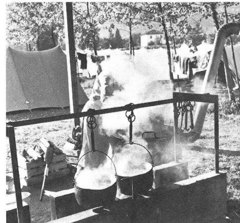
Kochkessi-Romantik 1965 – auch heute noch!

Ab 1964 begann die Anpassung des Hauptgebäudes an die neuen Anforderungen. Küche, Speisesaal, Unterkünfte und sanitäre Anlagen wurden renoviert. Dazu wurde ein Stück Kulturland freigegeben, um zusätzlich einen Zeltplatz zu eröffnen. Ein alter Stall, umgeben von einem schönen Baumbestand, ausgerüstet mit Militärkesseln, Abwaschtrögen und Holztischen bildete das Zentrum des Zeltlagers. Von Anfang an versuchten wir mit einem Mini-