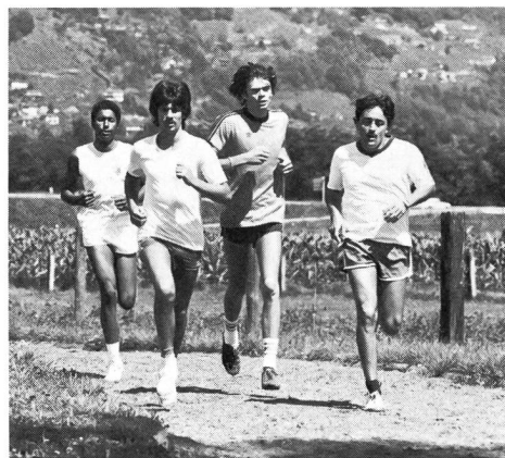
Die Finnenbahn – ein Ort der Begegnung.

Dazu kommen noch Informationen über den Verein, die Schule oder die Mannschaft, über das Alter der Teilnehmer sowie über Transportmöglichkeiten (zum Beispiel Velo).