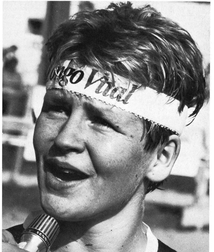
Die Norwegerin Ellen-Sofie Olsvik, unangefochtene OL-Weltcupsiegerin trotz relativ schlechter Laufzeit.