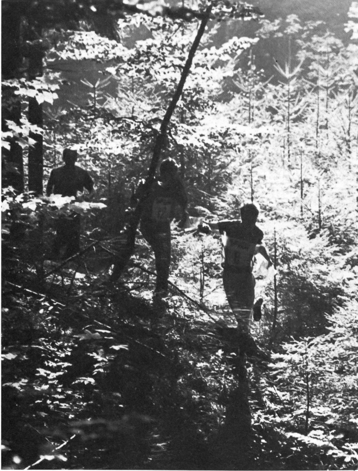
Der ganze Zauber des OL: Oevin Thon (Norw.), 3. Rang (nur mit einem Sieg hätte er den Weltcup gewinnen können), vor dem Schweizer Christian Aebersold, 19. Rang und Weltcup Sieger Kent Olsson im zweiten Lauf bei Posten 1.