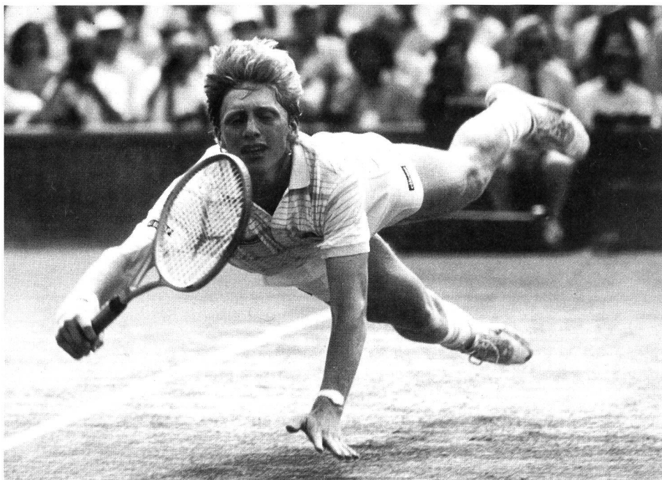
Tennis-Akrobatik: Boris Becker, wer denn sonst?