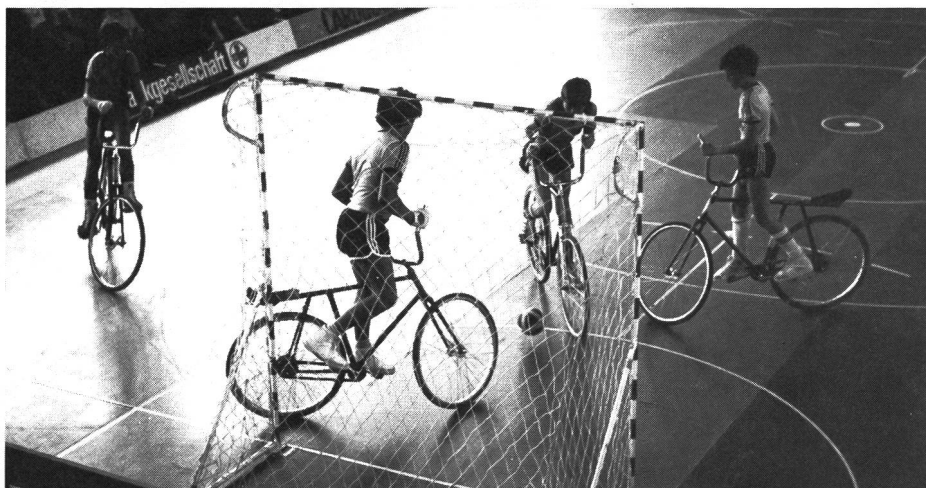
Radball, neu in Jugend+Sport.

Womit wir uns sehr weit vom HallenradSPORT entfernt haben, doch ist ja Sport immer auch ein Teil von «Welt» und wir deren Kinder. Eine Betrachtungsweise, welche im Sport nur selten zum Ausdruck kommt. ■