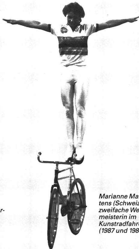
Marianne Martens (Schweiz), zweifache Weltmeisterin im Kunstradfahren (1987 und 1988).