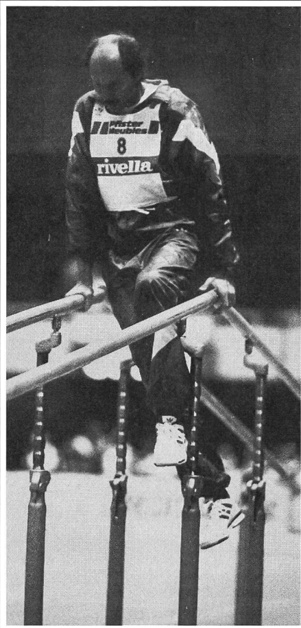
Publikumsliebling Jacques Cornu.