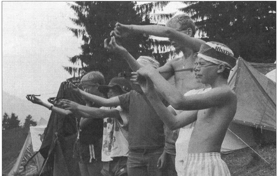
Orientierungs- und Erkundungsübung im Lagergelände.