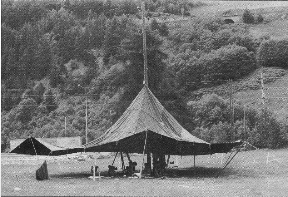
Unglaublich aber wahr: Ein Sarassanizelt am Stromleitungsmast befestigt.