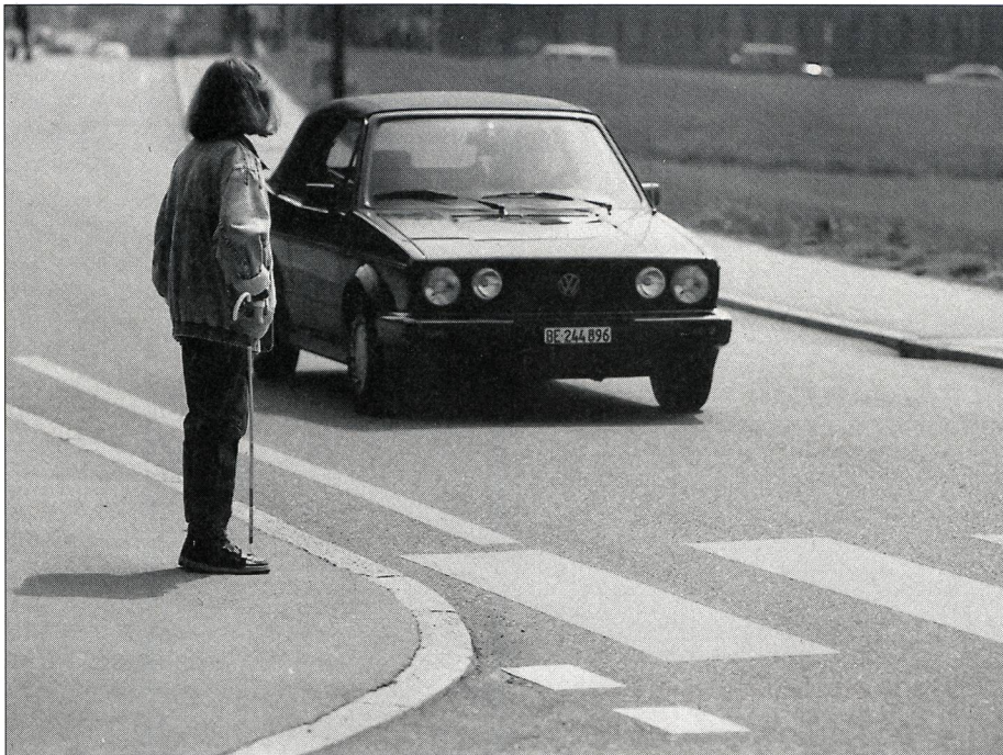
Höchste Konzentration und ein ausserordentlich differenziertes Hören, in ungezählten Ausbildungsstunden geübt, ermöglichen es dem Blinden, sich im Verkehr zu bewegen.