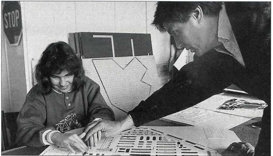
Einen direkten Nutzen für den täglichen Gebrauch bringt die Arbeit mit dem Relief des nahen Einkaufszentrums.