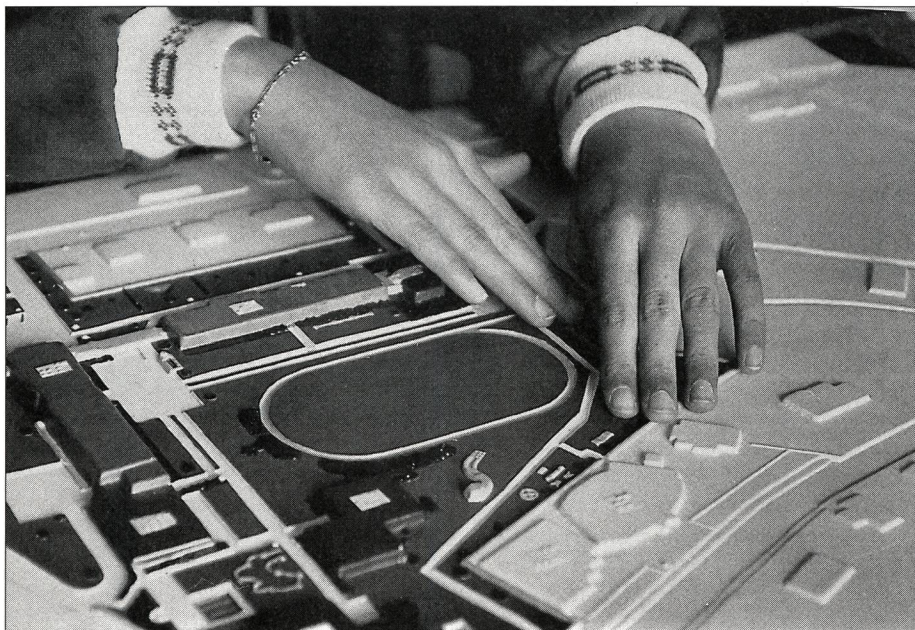
Wie liegt der Sportplatz im Vergleich zum Schulgebäude? Die Arbeit am Modell, hier an einem Relief der Schulanlage, gibt Antwort auf die Frage und ermöglicht es, eine Vorstellung von der ganzen Anlage aufzubauen.

Und weil dieses Wissen für sie lebenswichtig sein kann.