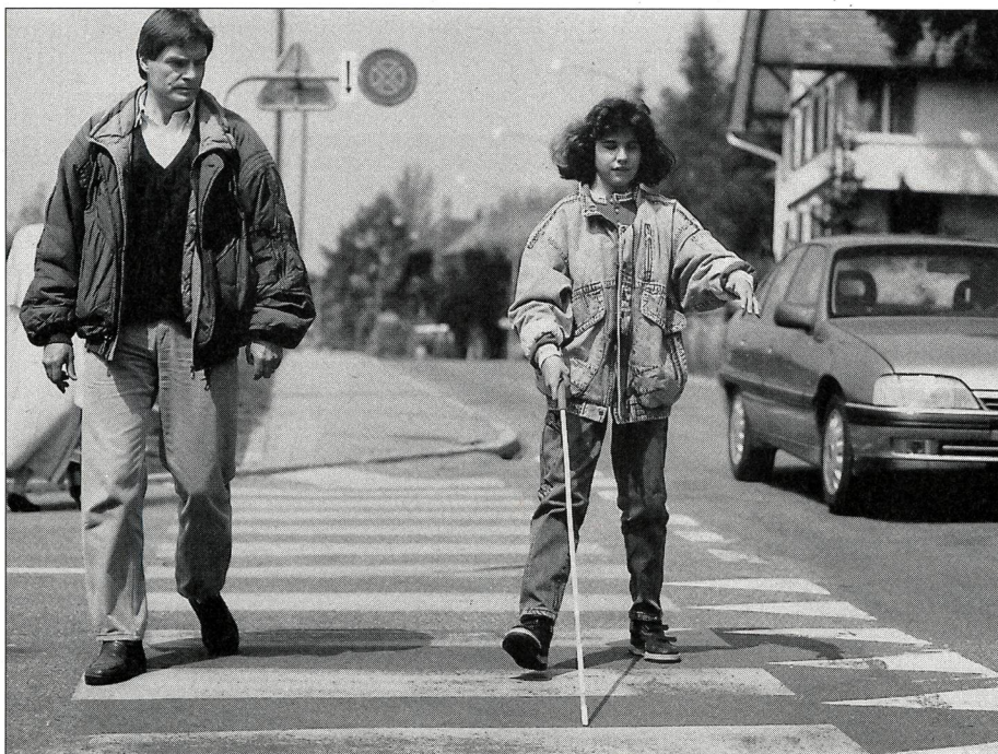
Mit zunehmender Erfahrung und steigendem Selbstvertrauen des Schülers kann der Lehrer später mehr und mehr in den Hintergrund treten.