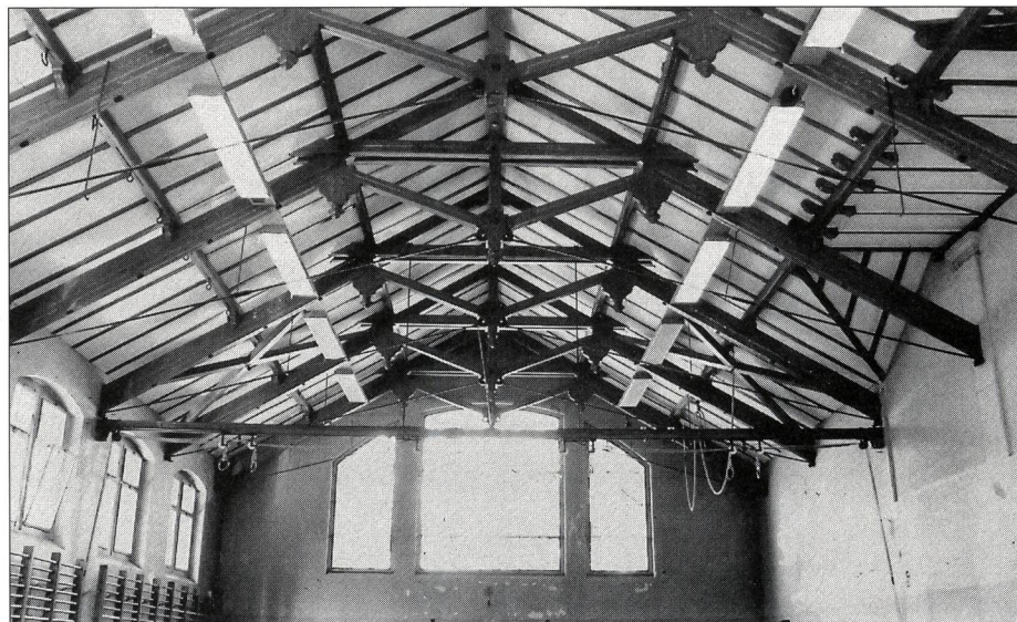
Turnhalle Spitalacker, Bern: Sehenswerte Dachkonstruktion. Fläche zur Verbesserung der Akustik mit schallabsorbierenden Platten.

Die Verkaufszahlen bei den Sporthallenböden zeigen eine deutliche Verschiebung in Richtung Sanierung. Machten 1985 die Renovationen noch 20 Prozent aus, so waren es 1990 be-