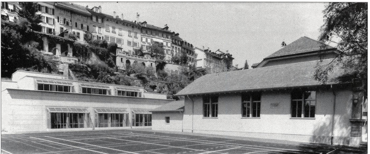
Turnhalle Matte, Bern: Rechts die alte, sanierte Halle, links die im Hang versenkte neue.