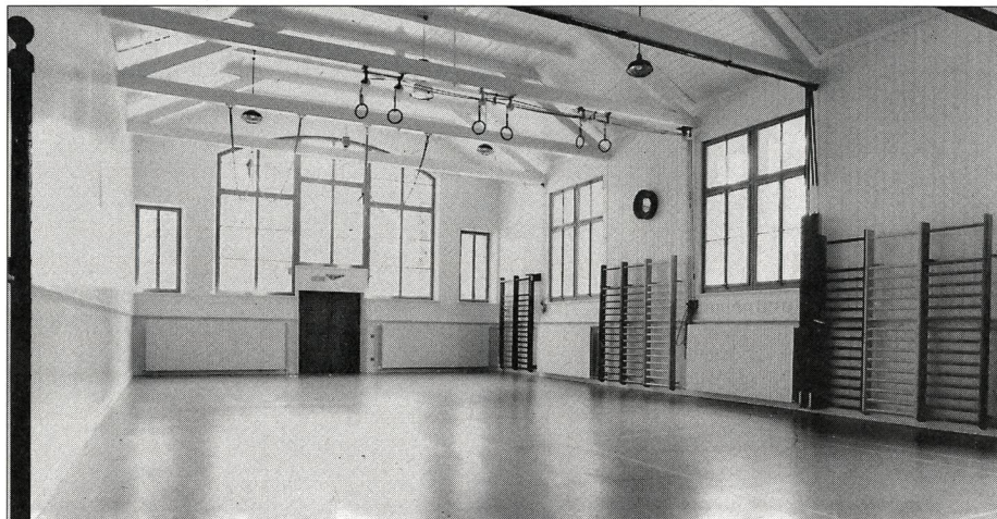
Sanierungen bedingen oft Kompromisse – hier bei der Beleuchtung; links einer der erhaltenen Reckpfosten der Turnhalle Matte, Bern.

Aufgrund dieser Forderungen wird in der Stadt Bern für die einzelnen Sanierungsobjekte jeweils eine Baukommission zusammengestellt. Diese wird von Fall zu Fall durch Fachspezialisten (Ingenieure, Denkmalpfleger, usw.) ergänzt.