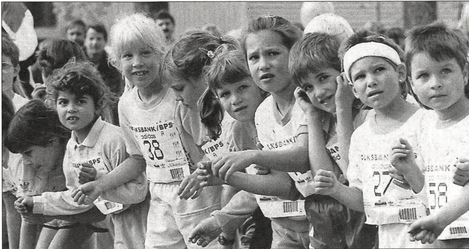
20 Jahre J+S. Am 26. Mai wird an der ESSM ein Jubiläumstag durchgeführt. Bundesrat Cotti wird anwesend sein, die Erziehungsdirektoren der Kantone werden kommen, zahlreiche Gäste und vor allem viele Jugendliche für eine faszinierende J+S-Schau.