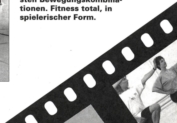
Fitness: Die Sportstudenten animieren zu den verrücktesten Bewegungskombinationen. Fitness total, in spielerischer Form.