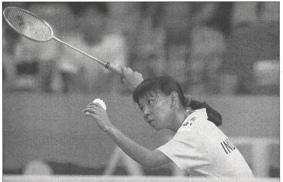
Susie Susanti (Indonesien) im Final, der ihr Gold brachte.

Dieses Antizipationsvermögen, ahnen, um feststellen zu können, nach wievielen Smashes die Gegnerin so müde ist, dass ein Drop folgen wird! Die Spieler müssen das Geschehen mental intensiv mitverfolgen, sich ins Spiel des