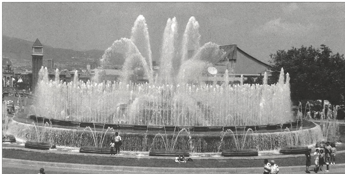
Was hinauf will, muss wieder hinunter... Font Magic, Wunderwerk der Brunnentechnik.

Haben die Asiaten Qualitäten, welche wir Weissen einfach nicht haben, oder kann man diese Überlegenheit mit der Tradition und dem «Know-how» begründen? Eine wissenschaftliche Untersuchung könnte helfen, Unterschiede aufzudecken und Fehlendes mit Methoden und Training wetzumachen und unsere spezifischen Qualitäten für das Badminton auszunützen. ■