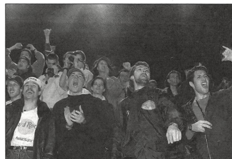
Erregungszustände durch Musik.

Musik begleitet uns tagein, tagaus, ob wir es wollen oder nicht. Wir befinden uns unter einer permanenten akustischen Berieselung. Der Radiowecker eröffnet den Tag. Musik ertönt beim Rasieren und Frühstück; Musik unterbricht die Morgenmagazine am Radio, erklingt immer dann, wenn der Sprecher gerade nichts mehr zu sagen hat. Auch auf dem Weg zur Arbeit, im Auto ertönt wieder Musik. Dazu umdröhnt uns der Lärm im Strassenverkehr, dieses ständige Rauschen, Hupen, Heulen, das Tosen der Stadt. Alles lärmt.