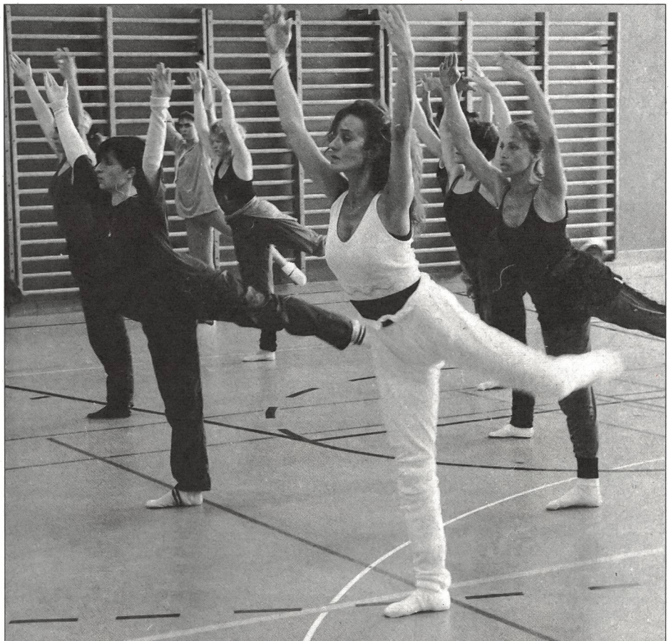
Musik zum Motivieren und Unterstützen: Themen der nächsten Kapitel.