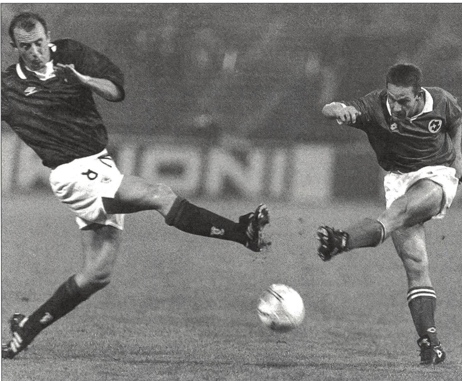
Tornähe: Zone knisternder Netzspannung.

«...Hast noch der Söhne ja!», hoffte die ältere Generation früher anlässlich ihrer nationalen Feierstunden. Dessen darf Fussballhelvetien nun, nach Jahrzehnten nagenden Zweifels, wieder gewiss sein. Und wer könnte die gelungene Wachtablösung der Generationen überzeugender signalisieren als der junge Held Stéphane Chapuisat, leiblicher Sohn des legendären Gabet Chapuisat. Jenen bewunderte ich zu seiner Zeit ebenfalls als nationalen Fussballhelden. Jetzt ist er also zusätzlich Helden-Vater. Die Idealvorstellungen drängen sich unwiderstehlich auf: Wie der kleine Stéphane den Vater bewunderte, ihm naheiferte, von jenem in harter Schulung gefordert und gefördert wurde, am väterlichen Sparringpartner emporwuchs, bis er diesen schliesslich sogar übertraf, um dessen Sache dann um so besser weiterzuführen. Die Bilder sind eigentlich zu schön, um wahr zu sein. Aber meine Phantasie besteht darauf. Sie labt sich im Idealfall, auch wenn der einen welschen Namen trägt. In mir regt sich ein grosszügig verallgemeinerter helvetischer Vaterstolz: Dass «wir» es nun doch fertig gebracht haben, einen so kompetitiven Nachwuchs auf die Beine zu stellen! Ver-söhnung also über Generationen- und Röstigraben hinweg, weil der Ball richtig rollt? Heil dir, Helvetia. ■