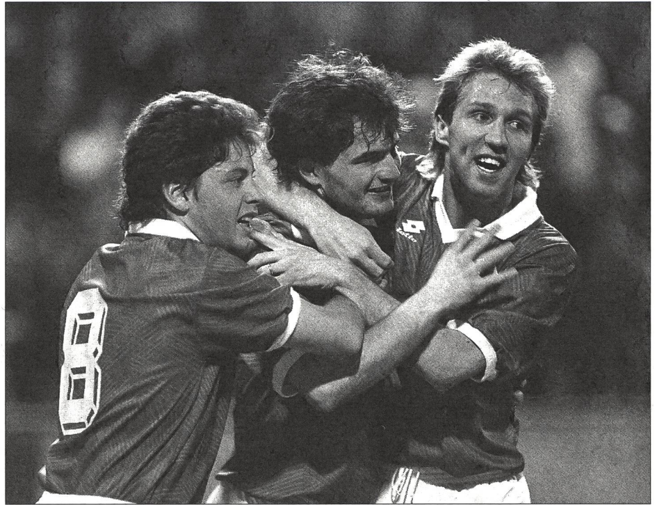
Chapuisat & Co., die Teufelskerle.

Heute schnurrt mein Unbewusstes schamlos beim Länderspiel. Wahrscheinlich infantile Allmachtgefühle oder ähnliches. Da die fussballerische Lage es erlaubt – soll ich es mir verbieten? Ich finde an der halluzinatorischen Wunscherfüllung nichts Verwerfliches, vorausgesetzt, sie wird augenzwinkernd und innerhalb gewisser spielerischer Reservate genossen, das heisst vorausgesetzt, Realitätskontrolle und Distanzierung bleiben jederzeit möglich.