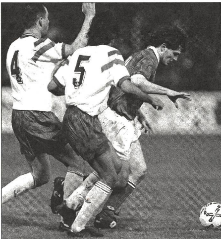
Sichtbarer Zug aufs Tor.

Dank Chapuisat & Co. haben wir (und sind wir) jetzt Teufelskerle, die an einem guten Tag gegen jeden Gegner gewinnen können. Dass wir in der Nationalmannschaft jetzt einen wie Knap aufstellen können, der unauffaltam Tor um Tor schiesst, stellt mich im doppelten Sinn mit auf.