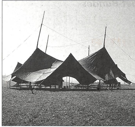
In der Natur leben.