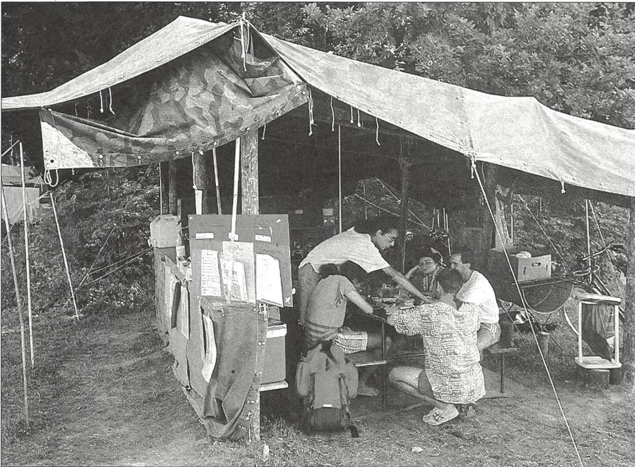
Aus gewohntem Komfort ausbrechen.