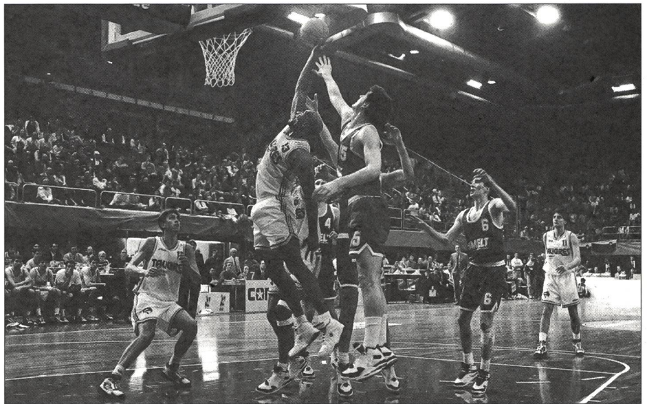
Grosse Hallen müssen oft verschiedenen Zwecken dienen.