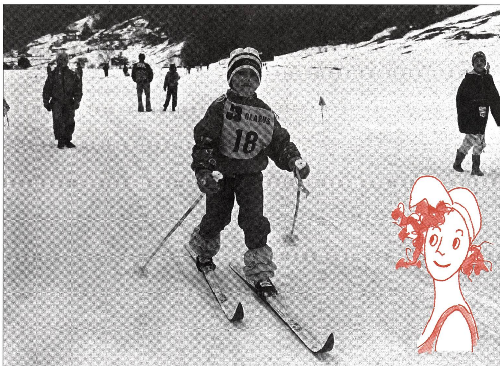
Wir beginnen mit dem Diagonalschritt.

Theo: Dir fehlt eben das Gleichgewicht auf den schmalen Latten. Auch das ver-