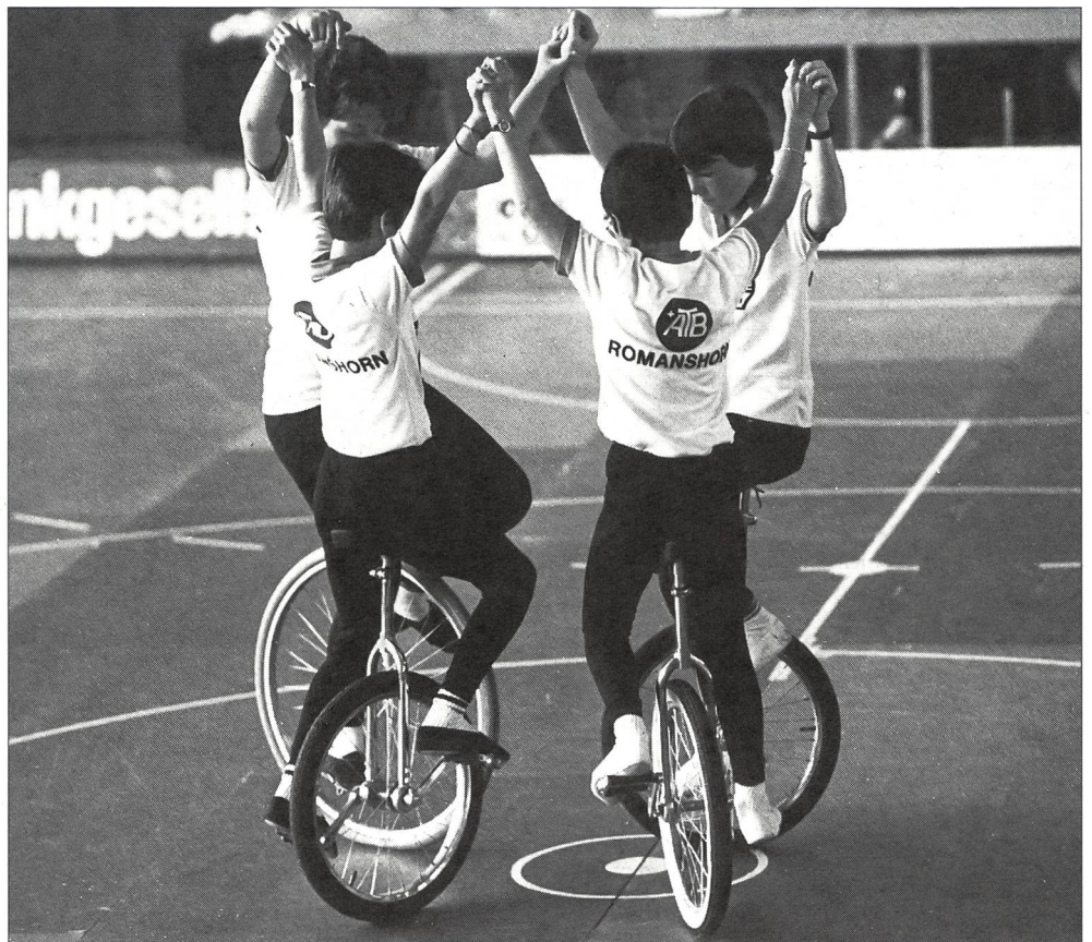
Was will der Verein mit seiner Jugendabteilung?

Eine gewisse Fluktuation ist sinnvoll und normal, wenn man bedenkt, dass die Wahl der Sportarten auch vom Alter abhängt. Ein Wechsel kann auch