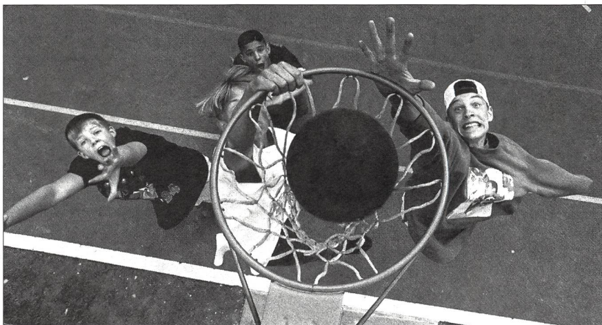
Die Faszination Spiel wird bleiben.

Untersuchungen zeigen, dass die künftige Freizeitgesellschaft gefährlich egoistisch und selbstverliebt werden könnte mit Auswirkungen auch auf das Vereinswesen. Zeigen sich bei den Kindern und Jugendlichen bereits Anzeichen dieser Bindungsunfähigkeit und der abnehmenden Bereitschaft sich langfristig zu engagieren?