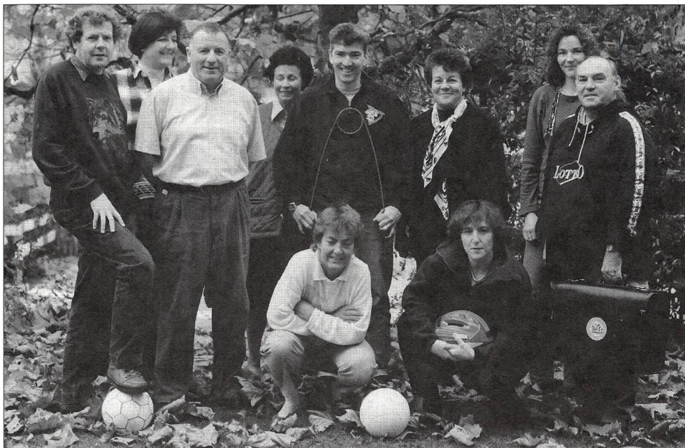
Die Mitarbeiter und Mitarbeiterinnen des J+S-Amtes Bern.

lich nur zwei Dutzend Unentwegte. Was blieb: 80 Liter Ovomaltine und reichlich Bratwürste, langsam auf dem Grill verkohlend.