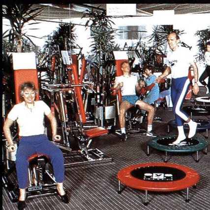
Freizeit- + Sportzentrum MIGROS Greifensee