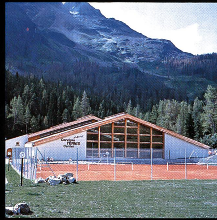
Corviglia-Tennis- und Squashhalle Kur- und Verkehrsverein St. Moritz