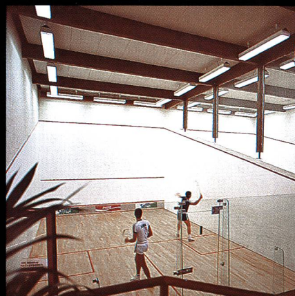
Swissair-Freizeitanlage Bassersdorf mit Squashcenter und Tennishalle

Riedhofstr. 45 Tel. 052 222 53 21 CH-8408 Winterthur Fax 052 222 65 01