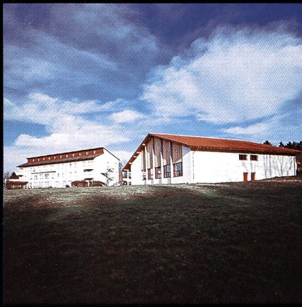
Bildungs- und Sportzentrum SVKT Chlotisberg Gelfingen