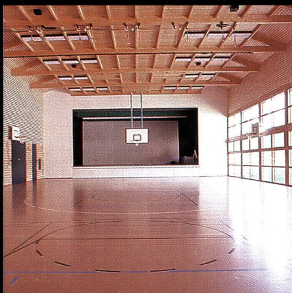
Mehrzweckhalle mit Bühne Progyzentrum Rebstein