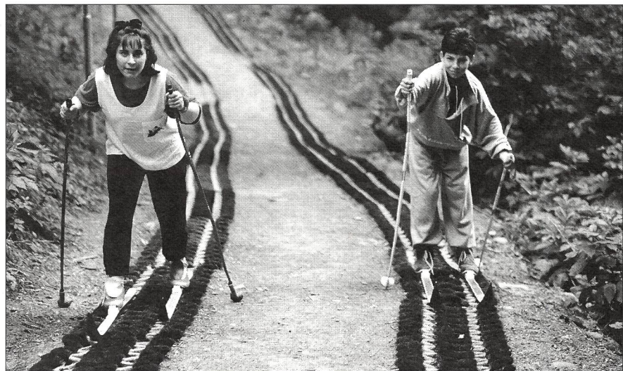
Zukünftige Mitglieder der italienischen Nationalmannschaft?

Jedes Jahr werden in Italien durchschnittlich 600 000 Kinder geboren; das sind 50% weniger als vor 25 Jahren. Parallel dazu zeugt die Zunahme des Durchschnittsalters von einer Verän-