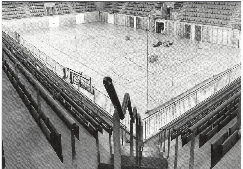
Neue Sporthalle Wankdorf mit flächenelastischem Holzboden.