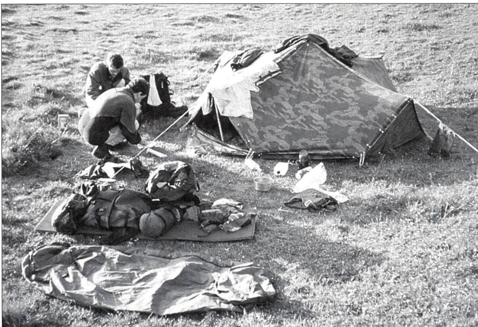
Biwakieren: «Learning by doing.»