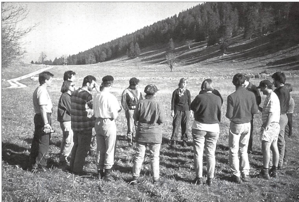
Auswertung und Feedback im Gelände.

Amesberger, G.: Persönlichkeitsentwicklung durch Outdooraktivitäten, Afra Verlag, 1992. ISBN 3-923217-57-9. ■