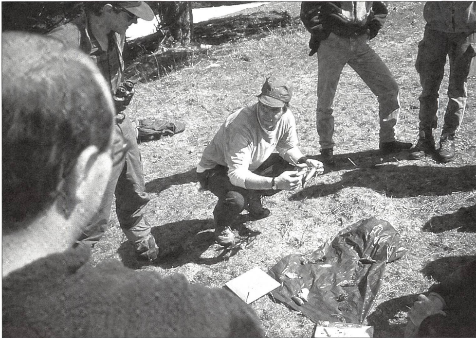
Ausbildungsstopp «Natur beobachten».