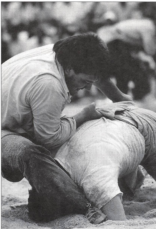
Schwingen ist in eine traditionelle Inszenierung eingebunden...