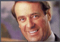
Adolf Ogi Bundesrat

Bildung ist auf den Menschen als Ganzes ausgerichtet. Hier hat der Sport – in der Schule und ausserhalb der Schule – seinen Beitrag zu leisten.