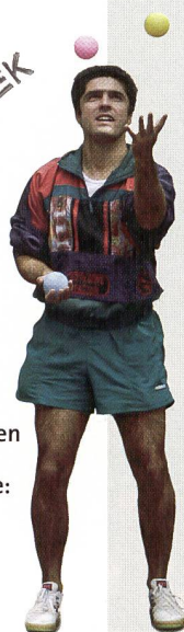
Jonglieren mit den drei Sportlektionen in der Schule: ein gefährliches Spiel!