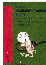
Sax, A. (2006). Familienratgeber Sport. Ein Buch für Eltern von Sportverrückten und Sportmuffeln. Zürich, Orell Füssli, 123 Seiten.

► Der Spielfächer ist ein neuartiges Lehrmittelkonzept, das sich an Sport unterrichtende Lehrpersonen und J+S Leitende oder Trainer/innen wendet. Die vier auf die verschiedenen Schulstufen angepassten Lehrmittel sollen die wichtigen Bausteine der Spielerziehung einfach, klar und schnell verständlich machen. Das 36-teilige Kartenset lässt sich «auffächern», damit man sich anhand der farbigen Kopfzeile orientieren kann. Die sechs bis sieben Themen («Skills») pro Fächer sind in sich so aufgebaut, dass sie die Entwicklung von Spielfertigkeiten fördern. Vorbereitende Aufgaben für den Lernstart, skizzierte Bewegungsabläufe, abwechslungsreich und stufengerecht präsentierte Übungs- und Spielformen sowie Testformen garantieren einen gezielten Aufbau. Das Lernmodell EAG ist unschwer zu erkennen; ebenso können Lernprozesse mit der Differenzierung «Erleichtern» und «Erschweren» beschleunigt werden. Die Karten können auch als Postenblätter Verwendung finden und als selbstständig zu lösende Werkstattaufgaben benutzt werden. Im Wissen darum, dass vor allem Lehrkräfte der Primarschule als «Zehnkämpfer» häufig nicht die Zeit für eine ausgedehnte Planung des Sportunterrichts aufbringen, dürfte diese rezeptartige, aber qualitativ auf einem sehr guten Niveau gehaltene Unterrichtshilfe grossen Zuspruch bei verschiedenen Adressaten finden. Duri Meier