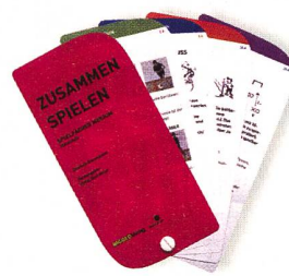
Owassapian, D. (2006). Spielfächer «basic»: Spielen lernen (Kindergarten, Unterstufe) Spielfächer «medium»: Zusammen spielen (Primarstufe 3.–6. Klasse) Spielfächer «high»: Im Team spielen (Sekundarstufe 1) Spielfächer «top»: Anders spielen (Sekundarstufe 2) Herzogenbuchsee, IngoldVerlag. www.ingoldverlag.ch

Der Autor beschreibt weiter anhand einem Grundkonzept der Spielentwicklung, wie man sich systematisch einer Teamentwicklung nähern kann. Die beiliegende CD-ROM begleitet und unterstützt die Konzeption mit hilfreichen Arbeitsblättern. Der Fokus ist nicht nur auf Mann- und Frauschaften gerichtet. Es wird auch erwähnt, wie die Teamfähigkeit in Sportarten wie Laufen und Turnen gefördert werden kann. Zahlreiche Fotos erleichtern die Verständlichkeit der einzelnen Übungsbeschreibungen und illustrieren Situationen aus der Praxis. Nora Weibel