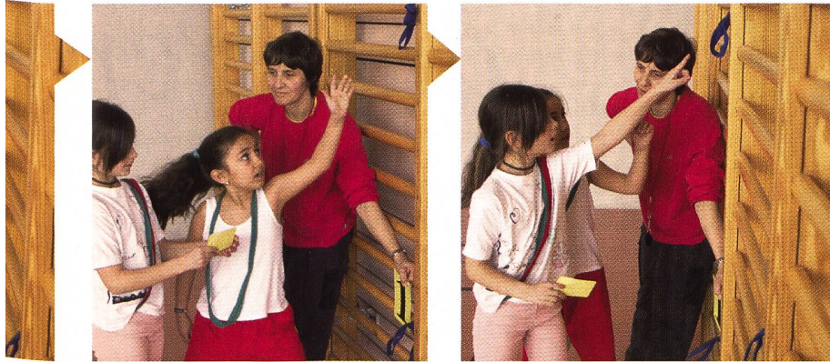
Verbal und nonverbal: Klare Botschaften sind gefragt.

Erkennen von verschiedenen Anwendungsmöglichkeiten wird die Bewegungsvorstellung erweitert und somit der Lernprozess bewusster gemacht.