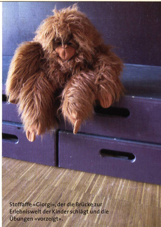
Stoffaffe «Giorgi», der die Brücke zur Erlebniswelt der Kinder schlägt und die Übungen «vorzeigt».

«Wenn ich auf dem Bauch liege oder am Schreibtisch sitze, es geht immer um das Gleiche: Ich muss mich gegen den Zug der Schwerkraft aufrichten bzw. aufrecht halten können.» Angela Nacke erläutert im anschließenden Theorieblock noch einmal das Ziel der vorgestellten Übungen. Auch im Hinblick auf grafomotorische Fertigkeiten sei diese Fähigkeit zentral, denn nur wer durch eine aufrechte und ökonomische Haltung die Arme entlasten kann, sei fähig, einen Stift locker über das Papier gleiten zu lassen. Es geht also immer darum,