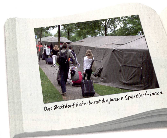
Das Zeltcamp beherbergt die jungen Sportler/-innen.

trainieren und sie erst noch nach Tenero begleiten.» Zwölf Teams, achtzig Schüler/-innen und drei Fachlehrer: Für den Kanton war die Teilnahme in Tenero ein Meilenstein, trotz kleinerer organisatorischer Probleme. «Und einige Eltern sehen es lieber, wenn ihre Kinder lernen, anstatt an solchen Anlässen teilzunehmen», erklärt Florian. Dazu kommen noch Transfer- und Übernachtungskosten. Kosten, die zu 100 Prozent von den Schulen und vom Schulsportamt gedeckt werden.