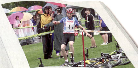
Auch ein nasser Triathlon ist ein guter Triathlon.