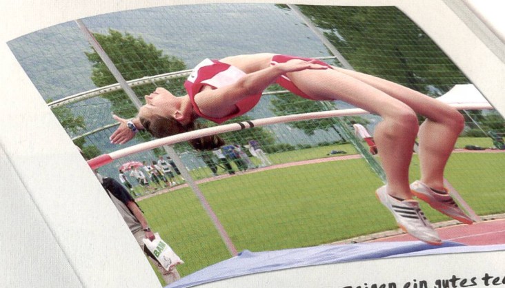
Einige Athletinnen zeigen ein gutes technisches Niveau.