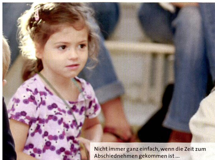
Nicht immer ganz einfach, wenn die Zeit zum Abschiednehmen gekommen ist...