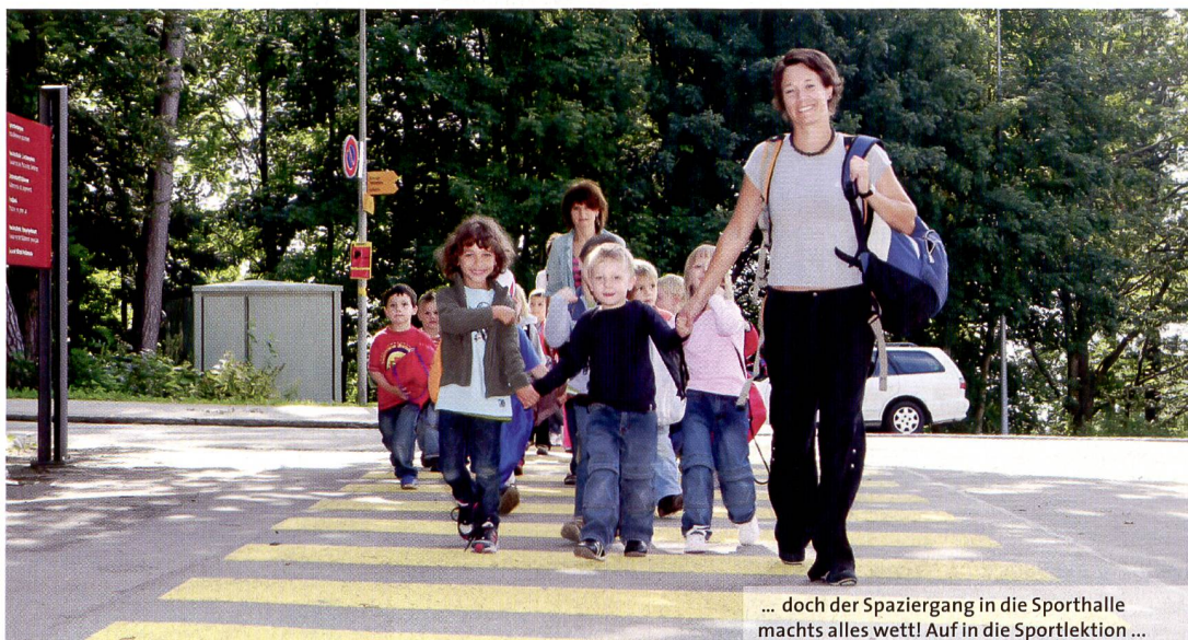
... doch der Spaziergang in die Sporthalle machts alles wett! Auf in die Sportlektion ...