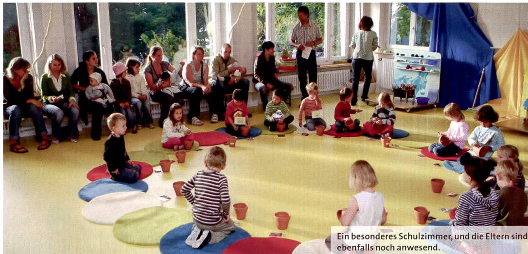
Ein besonderes Schulzimmer, und die Eltern sind ebenfalls noch anwesend.