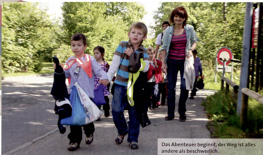
Das Abenteuer beginnt, der Weg ist alles andere als beschwerlich.